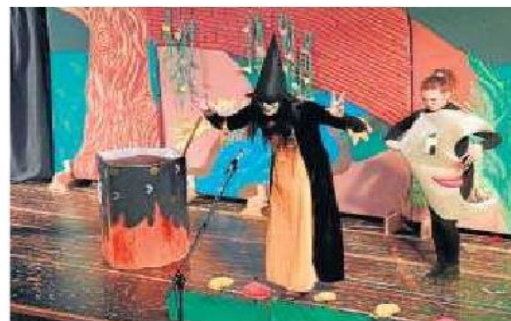
La magia y la brujería tampoco faltan en la representación.