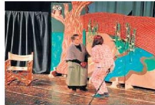
Mayores y alumnas del ciclo de Educación Infantil compartieron escenas.