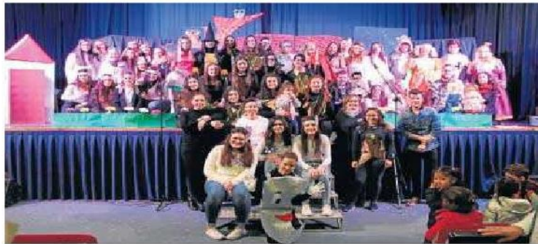
La obra contó con un nutrido reparto de varias generaciones para dar vida a todos los personajes.

La hora de espectáculo transcurre entre divertidos bailes, canciones, escenas de diferentes cuentos populares adaptados, y una continua interacción con el público, que se convierte en un personaje más de la trama.