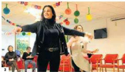
1. Alumnas, profesores, mayores, director y organizadores de esta actividad. 2. Alumnas del ciclo de Educación Infantil ensayan una de las escenas de 'El sueño de la luna'. 3. Profesores y mayores se toman los ensayos muy en serio, preparando sus papeles frente al espejo. 4. Un grupo se ha encargado de realizar todos los decorados. 5. Durante semanas se ha fraguado una relación de amistad entre los jóvenes y los mayores. 6. La luna es la protagonista.