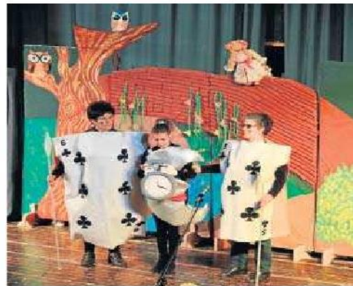
La luna vive numerosas aventuras durante la noche.

La hora de espectáculo transcurre entre divertidos bailes, canciones, escenas de diferentes cuentos populares adaptados, y una continua interacción con el público, que se convierte en un personaje más de la trama.