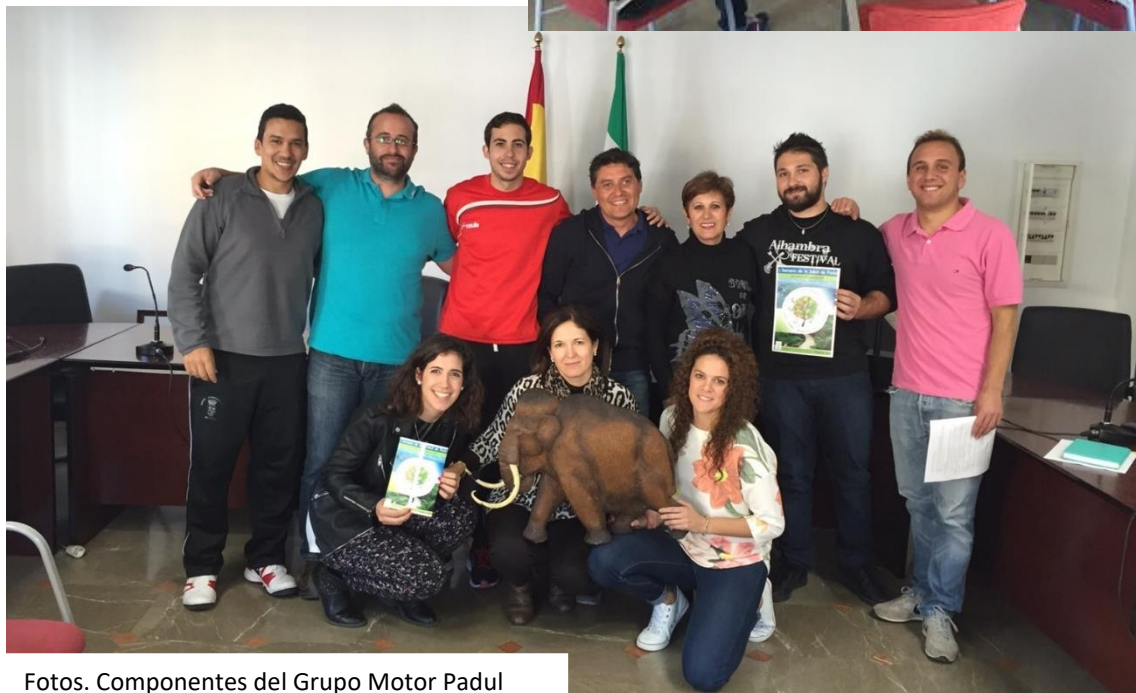
Fotos. Componentes del Grupo Motor Padul